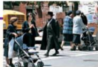
Barrio judío en Nueva York.

Luego de las revoluciones burguesas, el nacionalismo adquirió un rol central para la política: en el siglo xx comenzó a utilizarse como criterio para delimitar qué pueblos se integraban a un Estado y cuáles quedaban excluidos de él. Es el denominado "principio de las nacionalidades". Este principio orientó la política de cada Estado con respecto a los demás y llevó a discutir los límites territoriales.