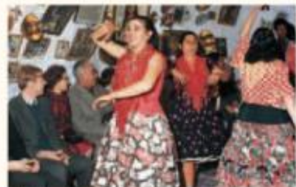
Bailarinas gitanas danzando para turistas, España.