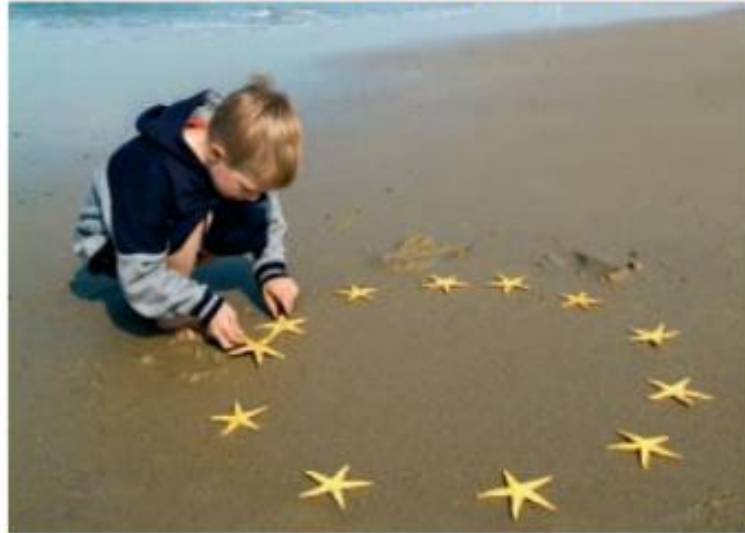
Niño haciendo con estrellas de mar el emblema de la Unión Europea.

Corresponden a Estados nacionales que se fueron conformando en el transcurso de la historia.