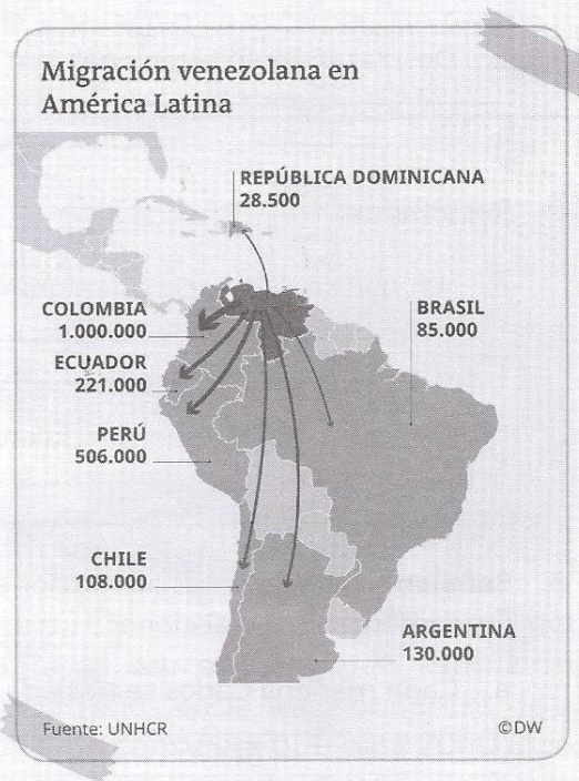
Migración venezolana

mentalmente joven (un 42% tiene entre 26 y 35 años) y calificada, con una importante cantidad de profesionales que cuentan con título.