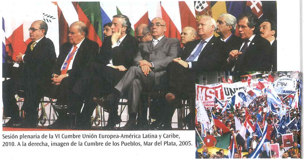
Sesión plenaria de la VI Cumbre Unión Europea-América Latina y Caribe, 2010. A la derecha, imagen de la Cumbre de los Pueblos, Mar del Plata, 2005.

Pensaremos a la política en dos sentidos: como ámbito de lo público y del interés general, atravesado por conflictos y por relaciones de poder, y también como lugar en el que es posible expresar las inquietudes y participar para construir una sociedad mejor.