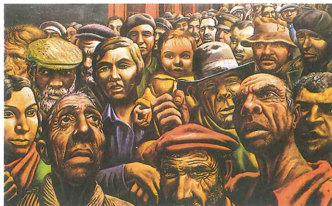
Manifestación, pintura de Antonio Berni, 1934.

En las últimas décadas, la conflictividad social se tornó más compleja debido a la presencia de intereses más variados y por la fortaleza creciente del mercado en detrimento de los Estados. Por esa razón, incluso para las corrientes posmarxistas , la política contemporánea consiste en manejar el poder y encauzar el conflicto por medio de consensos en el contexto del sistema democrático.