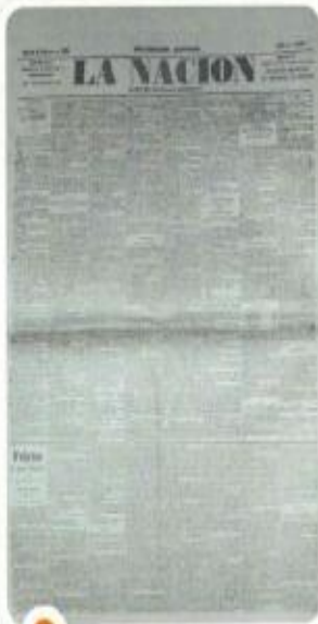
El diario La Nación fue fundado por Mitre en 1870.