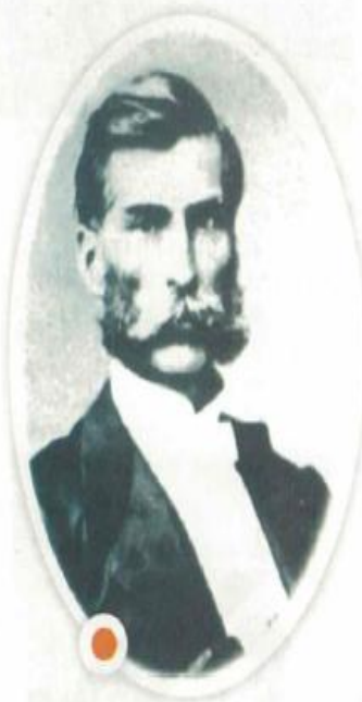
Felipe Varela fue, al igual que Peñaloza, uno de los caudillos federales del Interior que luchó contra el rosismo bonaerense en la etapa de las autonomías provinciales.

Mientras Peñaloza se enfrentaba a las fuerzas nacionales, tropas francesas ocupaban la ciudad de México y nombraban a Maximiliano de Habsburgo como Emperador.