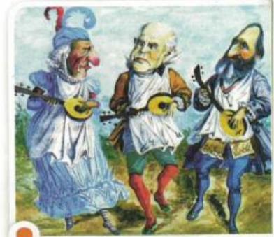
Caricatura que muestra a Sarmiento junto a Dalmacio Vélez Sársfield y Adolfo Alsina, publicada por la revista El Mosquito .

Estos datos precisos impulsaron la mayoría de las políticas gubernamentales de la presidencia de Sarmiento.