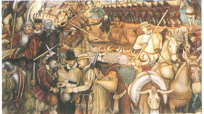
Desembarco de los españoles en Veracruz, mural de Diego Rivera.

La palabra "poder" y otras que derivan de ella se utilizan con distintos significados. Por ejemplo, cuando decimos "puede que la manifestación sea multitudinaria", nos referimos a la posibilidad de que algo suceda. En cambio, "la ciudadanía pudo votar libremente" se refiere a la capacidad de actuar de una persona o grupo, y "el Congreso tiene en su poder la decisión", al dominio sobre algo. Este capítulo tratará sobre el poder social y político, es decir, formas de relación entre personas y grupos.