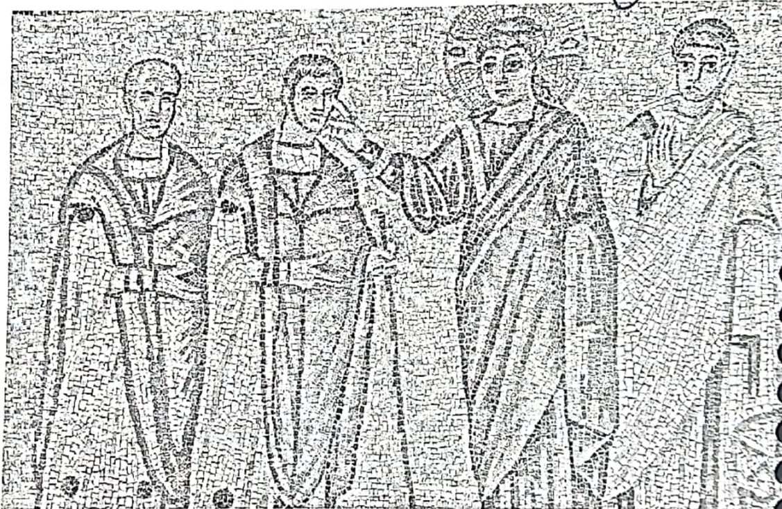
Curación del ciego de Jericó. s. IV. Rávena. Italia.

Por medio de los Sacramentos, Cristo resucitado realiza hoy en su Iglesia los mismos gestos salvadores que realizó en su vida terrena. 70