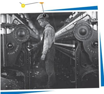
En muchas fábricas contrataban a los niños para hacer los trabajos más riesgosos, como quitar los restos de algodón que caían debajo de las máquinas.

En Chicago, el 1 de mayo de 1886, una huelga fue ferozmente reprimida y varios de sus protagonistas condenados a muerte. El objetivo de la huelga fue pedir que los obreros no trabajaran más de ocho horas por día. En 1889, la Segunda Internacional decidió instituir el Primero de Mayo como jornada de lucha para perpetuar la memoria de los trabajadores que murieron peleando por una jornada de ocho horas. En el país la primera conmemoración tuvo lugar el 1° de mayo de 1890. Hoy, en casi todo el mundo, menos en los Estados Unidos, el 1° de mayo se conmemora el día del trabajador.