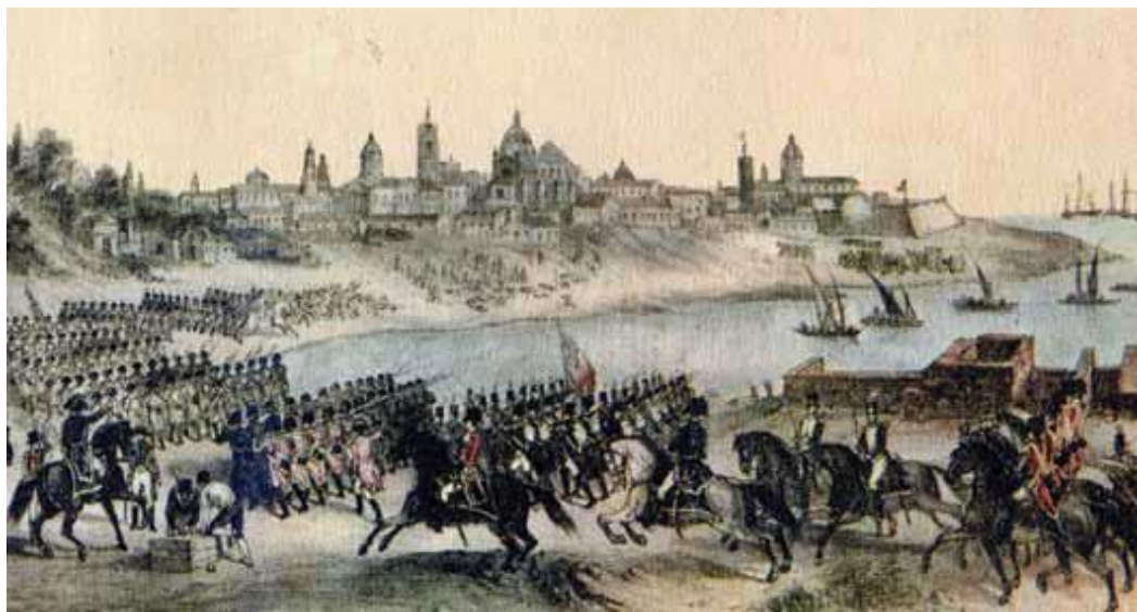
Un ejército compuesto por alrededor de 1.500 ingleses avanza sobre la ciudad de Buenos Aires, luego de su desembarco, en junio de 1806.

El 25 de junio de 1806, tropas inglesas bajo el mando del general William Carr Beresford desembarcaron en Quilmes y comenzaron a avanzar rápidamente sobre la ciudad de Buenos Aires. El virrey Sobremonte, después de improvisar una débil resistencia que fue rápidamente dispersada por los ingleses, abandonó la ciudad y la dejó a merced del enemigo.