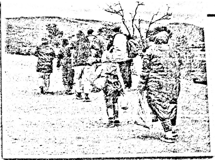
► Familia migrante serbia. Las migraciones son un fenómeno creciente que transforma a las familias.

Uno de ellos es la creciente incorporación de las mujeres en edad de tener hijos al mercado laboral, algo que incide en la postergación de la