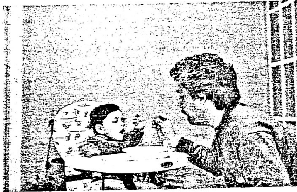
Hace algunos años los padres no enseñaban a comer a sus hijos, esto lo hacían las madres.

3. Observa estas dos imágenes, que ejemplifican actos y espacios de socialización, y descríbelas.