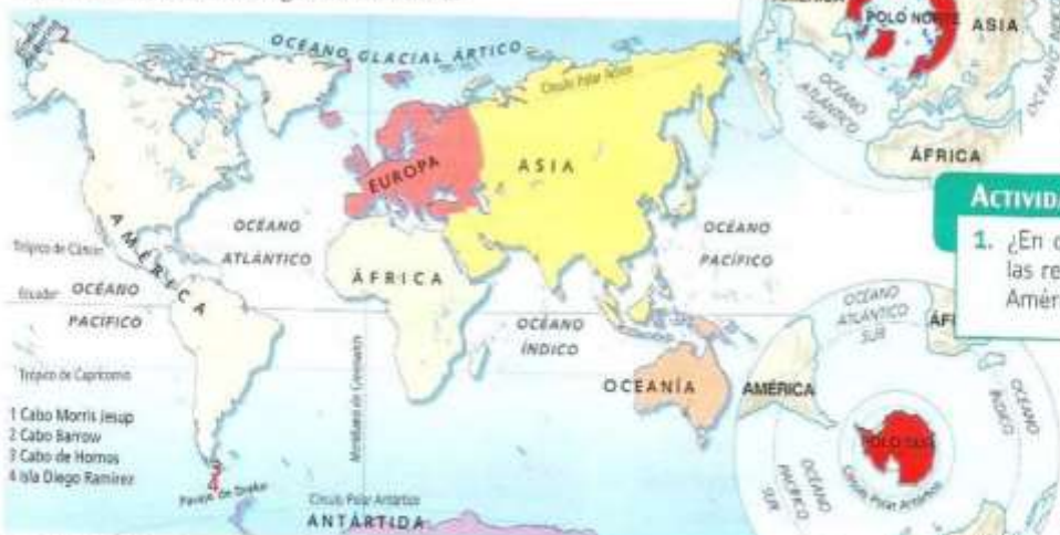
(Doc. 3) Posición de América en la superficie terrestre.

Las tierras más septentrionales se encuentran desplazadas más allá del Círculo Polar Ártico y están bañadas por el océano Glacial Ártico, por eso podemos hablar de la zona ártica del continente americano. Además, una serie de islas están próximas al Polo Norte. Entre el cabo Morris Jesup, en el norte de Groenlandia (a 83° 39'), y el Polo Norte solo median 7 grados de latitud.