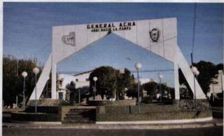
Entrada a la ciudad de General Acha, cabecera del departamento Utracán, en la provincia de La Pampa. Las provincias se dividen en sectores denominados departamentos. En el caso de la provincia de Buenos Aires, se denominan partidos.

También, como vas a leer en el capítulo 12, hay otros gobiernos que tienen autoridad en sectores más pequeños del país: los gobiernos provinciales , el gobierno de la Ciudad Autónoma de Buenos Aires y los gobiernos municipales o locales .