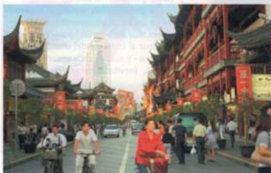
Vista de una calle de una ciudad china.

► Las desregulaciones que aplican los países para el intercambio con el mercado externo. A partir de la posguerra, los países centrales fueron aplicando distintos tipos de desregulaciones para el intercambio con los mercados externos. En especial, significó que redujeron el proteccionismo a través de cambios en los aranceles de importación, es decir, en los impues-