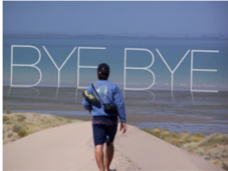
Bye bye.

Después de haber acabado nuestro proyecto, solo nos queda una tarea más por llevar a cabo: evaluar todo lo que hemos hecho . Se trata de que pensemos en qué hemos aprendido y en cómo lo hemos aprendido, es decir, en las actividades y tareas que hemos llevado a cabo.