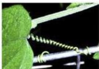
Note el zarcillo alrededor de la varilla de metal