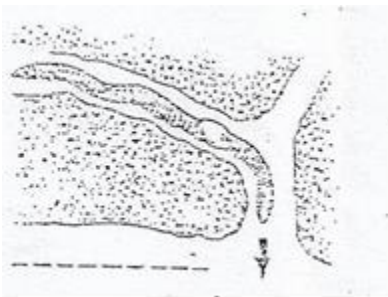
Lombriz buscando el suelo