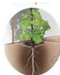
La raíz siempre crece hacia abajo (fuerza de gravedad)