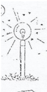
Moscas alrededor de la luz del foco