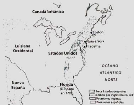
Doc. 6 Estados Unidos entre 1776 y 1783.

El segundo congreso se realizó en 1775, cuando la guerra ya se había iniciado, y en él se nombró a George Washington comandante en jefe de todas las fuerzas norteamericanas.