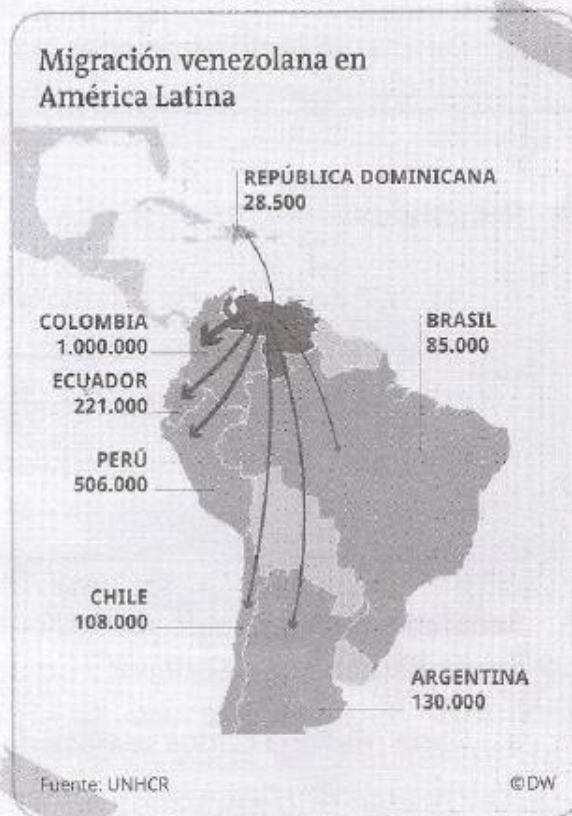
Migración venezolana

mentalmente joven (un 42% tiene entre 26 y 35 años) y calificada, con una importante cantidad de profesionales que cuentan con título.