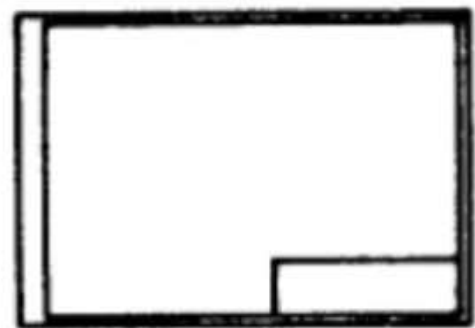
Figura 1 Hoja tipo "A"

Cada plano llevará en el ángulo inferior derecho un recuadro destinado al rótulo, según se establece en la Norma IRAM N° 4508.