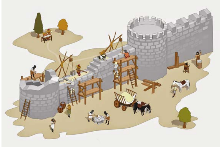
Dibujo libre del ilustrador: José A. Bermúdez (CC)

Entre los siglos III y XI se producen grandes migraciones de pueblos bárbaros ("extranjeros" para los romanos) que llegaron a Europa del sur y a la zona del Mediterráneo.