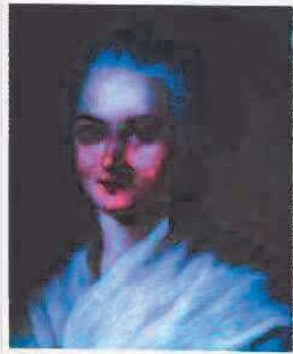
► En 1791 Olympe de Gouges escribió un documento llamado Declaración de los derechos de la mujer y la ciudadana. Sin embargo, ningún Estado lo adoptó en ese momento.

La igualdad ante la ley proclamada en esos años tampoco tomaba en cuenta las grandes desigualdades sociales y económicas que la Revolución Industrial venía causando en la vida de los trabajadores. Las huelgas obreras que se sucedieron durante el siglo siguiente y la formación de sindicatos fueron el modo de demandar por nuevos derechos económicos y sociales, como el derecho de huelga, la prohibición del trabajo infantil y otros, que luego los Estados se vieron obligados a hacer cumplir.