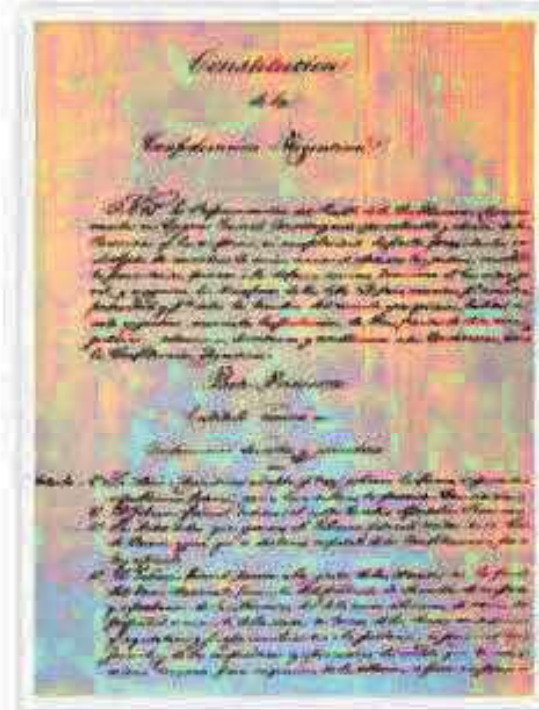
► Facsimil del Preambulo de la Constitución de la Nación Argentina, sancionada en 1853.

A esto también puede sumarse la idea de orden social. Es decir, qué se considera mejor y más deseable para todos. En tal sentido, se considera que el derecho es un sistema de normas obligatorio inspirado en un criterio de justicia.