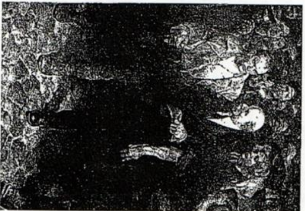
A El dirigente socialista apodado Lenin, durante la revolución de 1905. óleo del pintor ruso Valentin A. Serov.

El Imperio ruso era gobernado por el zar Nicolás II, quien tenía amplios poderes. En 1905 estalló un movimiento revolucionario que exigió mejoras en la calidad de vida e intentó recortar ese poder. Si bien la revolu-