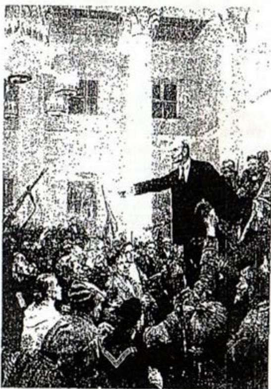
A Lenin pronunciando un discurso a los trabajadores del soviets de San Petersburgo, en 1917.