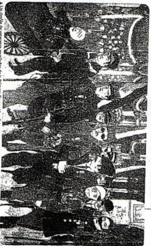
A Un desfile de veteranos mutilados de la Primera Guerra Mundial.

Como afirma José Luis Romero, "frente al desconcierto general, frente a la impotencia de los que querían ver claro antes de decidir la dirección a adoptar, hubo quienes asumieron el papel de portavoces [...]. Los dos más calificados se llamaron Benito Mussolini y Adolfo Hitler, pero hubo muchos más, y todos parecieron a sus oyentes legítimos portavoces de una nueva e ignorada verdad".