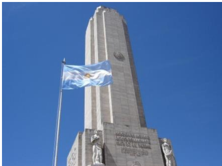
Monumento a la bandera. En Santa Fe.