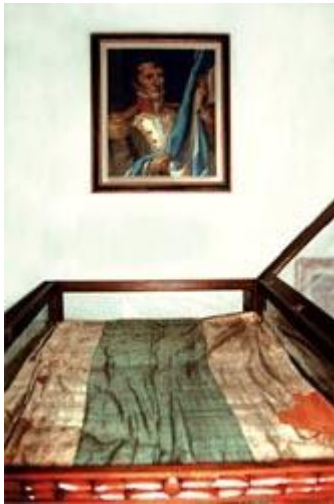
Bandera original izada por Manuel Belgrano