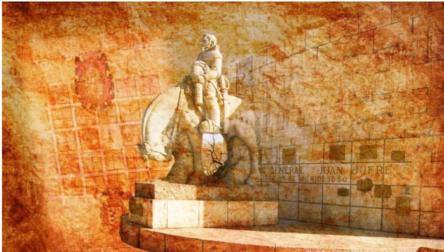
Monumento a Juan Jufre, en Concepción en Honor la Fundación de la Provincia.-