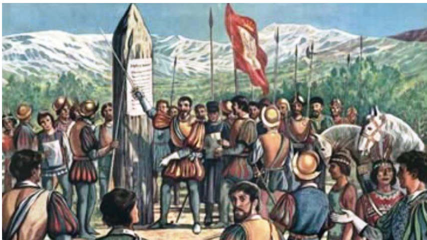
Momento de la fundación de San Juan.-