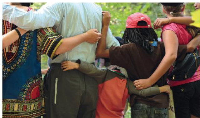
Figura 1.1 El ser humano es un ser social. Desde que nace comparte costumbres, tradiciones, lengua, normas y valores que interioriza y normaliza en su proceso de socialización

La intervención social no siempre ha sido ni se ha fundamentado en los mismos pilares que hoy se conocen. A lo largo del tiempo ha sufrido variaciones adaptándose a cada época y momento histórico y basándose en las creencias y paradigmas dominantes en cada periodo.