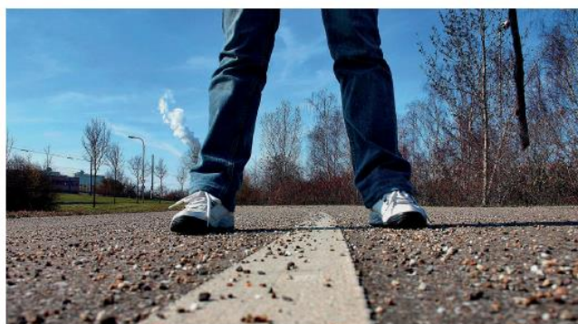
Figura 1.2 La intervención social parte de una idea de cambio

La intervención consiste en una serie de actividades y tareas programadas con detalle y con una metodología de trabajo concreta destinadas a la consecución de un fin. Quiere esto decir que la intervención requiere del trabajo de profesionales que se han puesto de acuerdo para desarrollar dicha intervención.