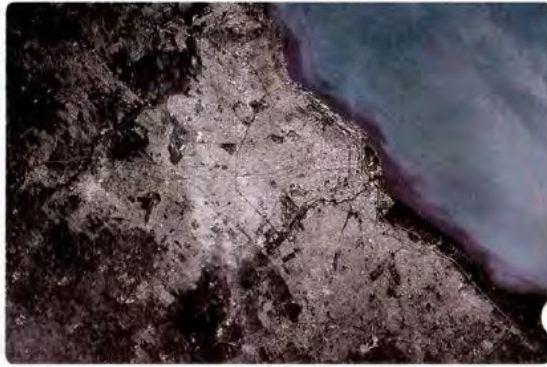
Ciudad Autónoma de Buenos Aires.

En 1996 se sancionó la Constitución de la Ciudad de Buenos Aires y se eligió al primer Jefe de Gobierno de la Ciudad (ganó la elección Fernando De la Rúa), que representó el Poder Ejecutivo local. También existe un Poder Legislativo unicameral, elegido por el voto popular: la Legislatura de la Ciudad , compuesta por sesenta legisladores (+INFO).