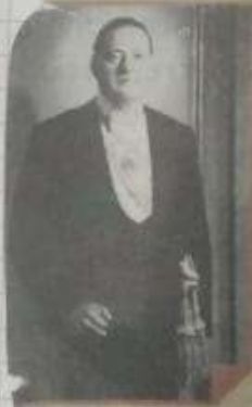
Roberto M. Ortiz

El presidente Roberto M. Ortiz , en 1939 creó la Junta de Recuperación de las Malvinas, que estaba compuesta por hombres de política y cultura. Ellos fueron los impulsores al colocar a calles, escuelas y bibliotecas los nombres de las islas. Esta Junta organizó un concurso poético musical, en búsqueda de una canción que representara los sentimientos de los argentinos por las islas.