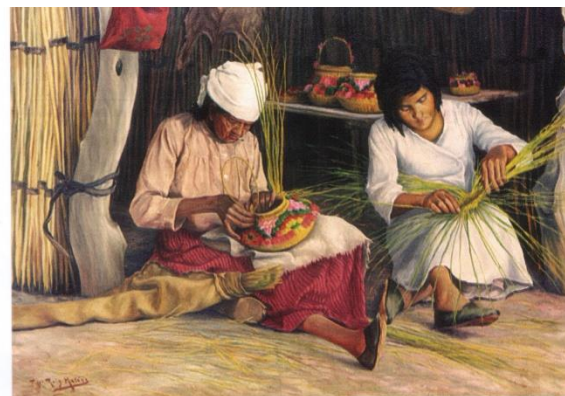
Las Canasteras. Óleo de composición 1691