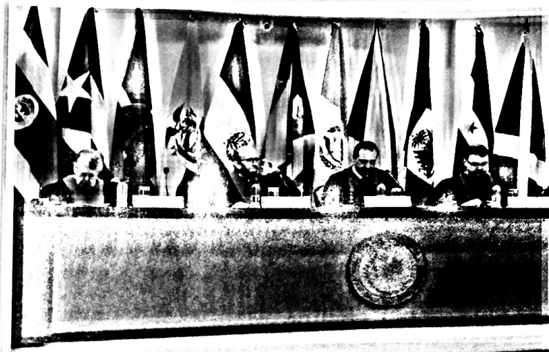
► La Corte Interamericana de Derechos Humanos cumple un rol central, ya que puede emitir sentencias obligatorias para los Estados.