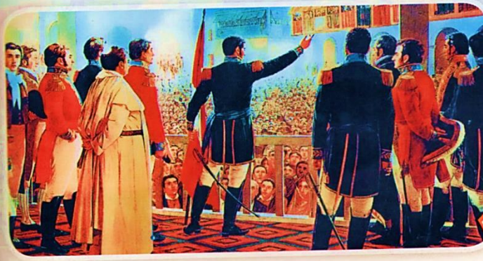
Este cuadro muestra a San Martín cuando se proclamó la Independencia de Perú.

Así se desarrollaron las campañas de San Martín... y de otros dos libertadores, que vas a conocer en la página siguiente.