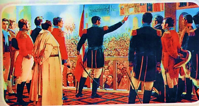
Este cuadro muestra a San Martín cuando se proclamó la Independencia de Perú.

Así se desarrollaron las campañas de San Martín... y de otros dos libertadores, que vas a conocer en la página siguiente.