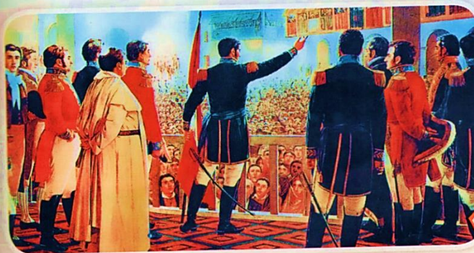
Este cuadro muestra a San Martín cuando se proclamó la Independencia de Perú.

Así se desarrollaron las campañas de San Martín... y de otros dos libertadores, que vas a conocer en la página siguiente.