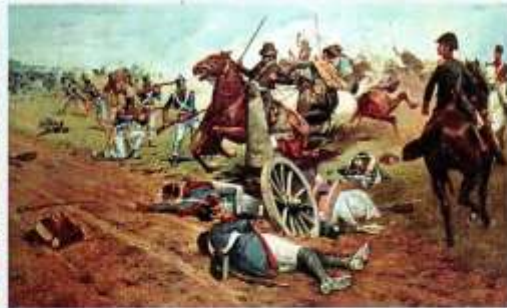
Una escena de Jujuy pintada en 1937 por el pintor argentino Antonio Berni y otra de la batalla de Tucumán, representada por Francisco Fortuny (detalles).