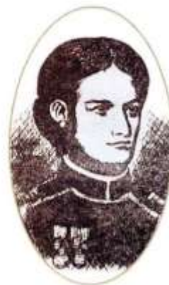
Retrato de Juana Azurduy.

Además de hombres para integrar los ejércitos, hizo falta dinero para comprar armas, uniformes, caballos, monturas y alimentos. Para poder costear esos gastos, el gobierno solicitó contribuciones en bienes, dinero o trabajo a la población y expropió (es decir que tomó con fines públicos) propiedades de los realistas.