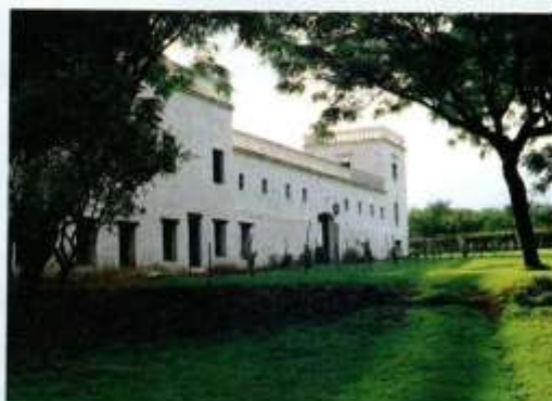
Córdoba: Museo de la Casa del Virrey Liniers en Alta Gracia y Casa de Caroya, donde funcionó una fábrica de armas durante la Guerra de la Independencia.