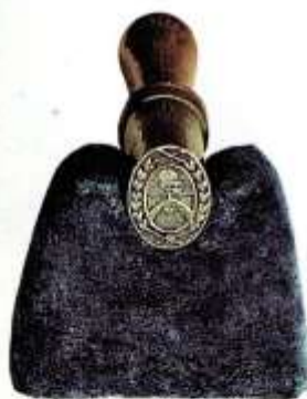
Sello de la Asamblea del Año XIII.

A pesar de su importante obra legislativa, la Asamblea no logró su cometido de declarar la Independencia ni dictar una constitución.