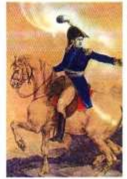
General Manuel Belgrano, litografía de Théodore Géricault.

Una vez en Tucumán, Belgrano desobedeció la orden del gobierno de retirarse a Córdoba y venció a los realistas en las batallas de Tucumán y Salta . Lamentablemente, su ejército fue vencido cuando intentó ocupar el Alto Perú.