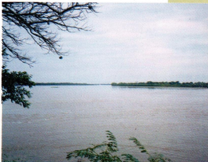
Confluencia del río Paraguay con el río Paraná.

En el río de la Plata tienen gran influencia los vientos Pampero y Sudestada. Cuando sopla con fuerza la Sudestada arrastra las aguas del río sobre la costa argentina provocando inundaciones en las zonas bajas de la llanura pampeana.