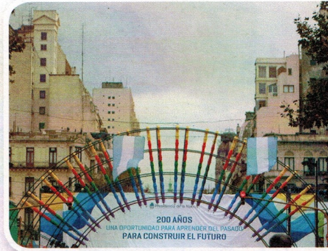
▲ En 2010 se celebró el Bicentenario de la Revolución de Mayo, celebración en la cual participaron muchas personas.

Cuando han ocurrido golpes de Estado en la Argentina, en los que las Fuerzas Armadas, con la colaboración de algunos civiles, tomaron el gobierno por la fuerza, sin haber sido elegidos por los ciudadanos, las instituciones estatales fueron controladas por el gobierno militar y la Constitución Nacional dejó de respetarse.