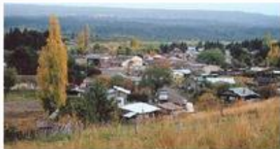
▲ Vista de la localidad de Trevelín, cerca de la Cordillera Andino-Patagónica en Chubut.

En los mapas representados se han utilizado unidades de superficie diferentes para calcular la densidad de población: en un caso es el área provincial, y en el otro, áreas urbanas y rurales dentro de cada provincia. Como podés ver, de acuerdo con la base espacial utilizada se puede identificar más o menos detalle sobre la distribución de la población en el territorio.