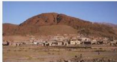
▲ Localidad de San Antonio de los Cobres, en la Puna de Salta.