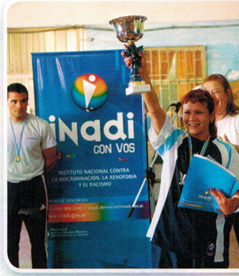
▲ El Instituto Nacional contra la Discriminación, la Xenofobia y el Racismo (Inadi) es un organismo estatal cuya función es elaborar políticas nacionales para combatir toda forma de discriminación, xenofobia y racismo.