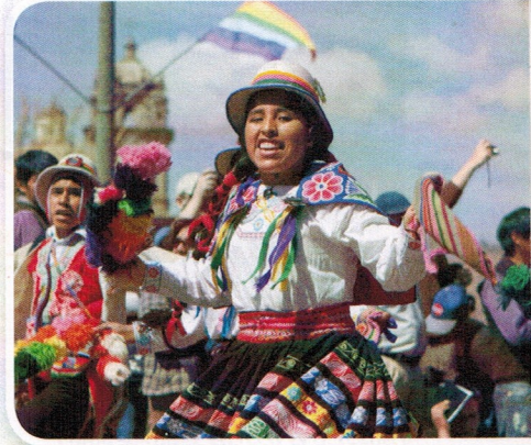
▲ Todas las personas tienen derecho a ser tratadas de forma igualitaria sin discriminar su cultura, religión o etnia, entre otros.

Qué podemos hacer. Desde nuestra cotidianidad podemos tratar a los otros compañeros con igualdad y no discriminar por ser de otra religión, nacionalidad, género o clase social. En muchas oportunidades las personas utilizan términos negativos para referirse a los otros, sin darse cuenta de que pueden lastimar a los demás. Las personas tenemos múltiples características que nos hacen únicas e iguales, al mismo tiempo. Una acción que podemos hacer es contarles a otras personas que los derechos humanos son para todos, sin diferenciación alguna.