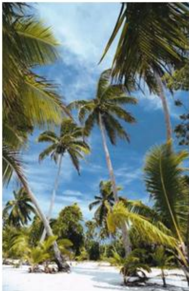
Imagen de una típica playa de clima cálido tropical.

La distribución de los climas en América responde, en general, a las condiciones de temperatura y precipitaciones . Sin embargo, existen algunos casos en los que las condiciones de altura y la cercanía al mar también influyen en la ubicación de los tipos climáticos.