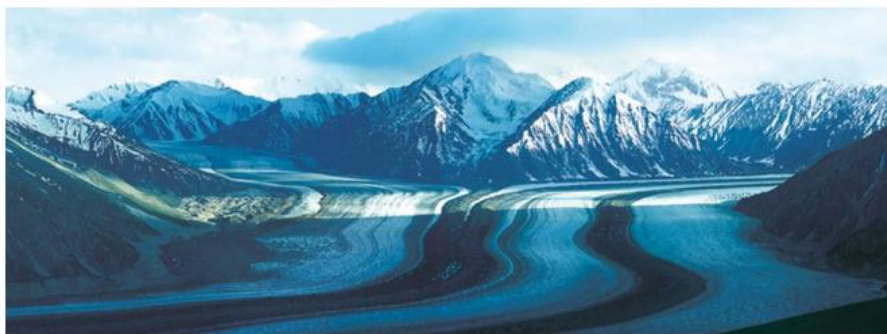
El territorio del Yukón, en Canadá, presenta un clima de frío polar.