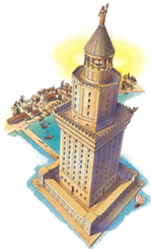
Faro de Alejandría

Sin embargo, en 313, contando 33 años, murió , Alejandro Magno dejando el mayor imperio conocido hasta entonces. Había fundado nuevas ciudades (como Alejandría, en Egipto), y expandido las ideas y la cultura griegas por los territorios conquistados, dando lugar a lo que se conoce como " Helenismo ".