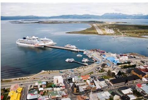
(Puerto de Ushuaia)

Pesca marítima en el sector Sur o Patagónico: los principales puertos del sector sur son los siguientes: Ushuaia, Madryn, Deseado, Comodoro Rivadavia y San Antonio Oeste. En el cual se capturan peces como la merluza, crustáceos como la centolla y moluscos como el calamar y mejillón.