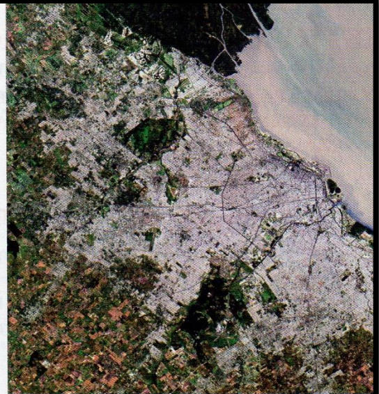
Imagen satelital del AMBA, la aglomeración más grande y más densa de la Argentina.

La mayor concentración de población se produce en el Área Metropolitana de Buenos Aires . Esta aglomeración está formada por la Ciudad Autónoma de Buenos Aires y 24 partidos de la provincia de Buenos Aires sobre los que se extiende total o parcialmente la mancha urbana, es decir la zona de edificación continua, casi sin interrupciones. Con una superficie de 2.590 km 2 y una población, según el censo de 2010, de casi 12.800.000 habitantes, representa el 32 % de la población de la Argentina.