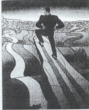
Por Koren Shadmi