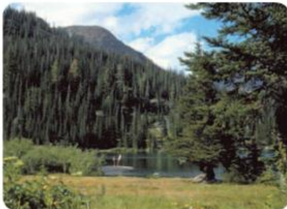
típico bosque de coníferas.