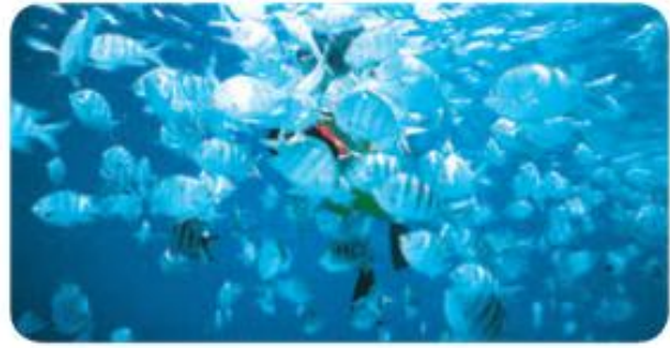
La biodiversidad en el fondo del mar.