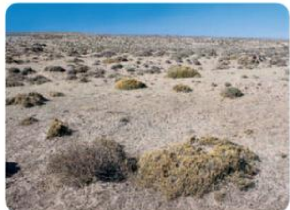
Vegetación característica de la estepa patagónica.