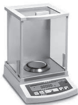
Figura 1. Balanza analítica

Antes de usar la balanza consulte el manual de operación o pida instrucciones al profesor. Además tenga presente que algunas sustancias químicas pueden ser corrosivas y al colocarlas directamente sobre los platillos pueden deteriorarlos. Utilice un papel filtro, un vidrio reloj o cualquier otro recipiente para pesar.