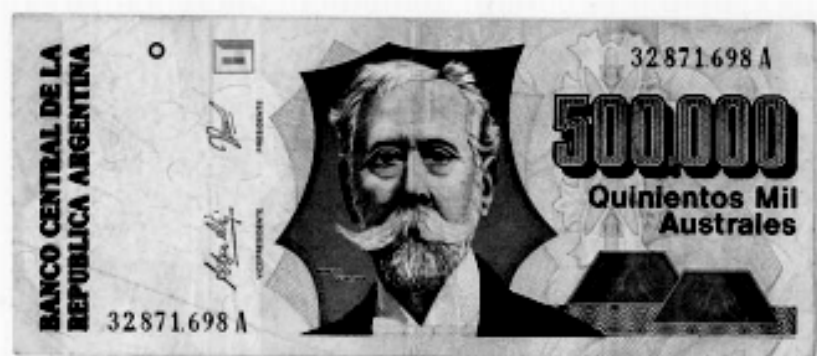
Billete de quinientos mil Australes

una deuda externa de 45.000 millones de dólares debida, entre otros factores, a la estatización de la deuda privada durante la dictadura. Esta deuda era equivalente a las exportaciones que se realizaban en un período de cinco años; quizás más, porque para colmo en ese momento estaban descendiendo los precios de los productos agrícolas. La banca acreedora y los grupos económicos concentrados ejercieron presión contra la política económica del ministro Bernardo Grinspun y el equipo fue cambiado en 1985. 11 Asumió Juan V. Sourrouille , que priorizó los condicionamientos expuestos por los grupos de presión. Alfonsín convocó al pueblo en apoyo a su gobierno y anunció la implantación de una "economía de guerra", que indignó a la gente que fue a la plaza. Pero el "Plan Austral" (plan económico con una nueva moneda) frenó la inflación y Alfonsín recuperó la confianza del pueblo. El gobierno disminuyó la deuda pública aplicando una desindexación a los acreedores internos. Se congelaron precios, tarifas públicas y salarios. Según David Rock, el plan no era muy diferente del de Rodrigo en la época de Isabelita, pero funcionó por el acuerdo público y gracias a ello el radicalismo obtuvo una victoria electoral en las elecciones para diputados en 1985. En 1987 ya se presentaron