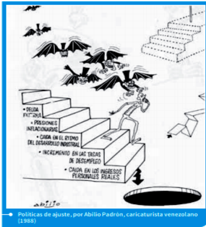
• Políticas de ajuste, por Abilio Padrón, caricaturista venezolano (1988)

perpetrado intencionalmente, con complicidad entre la cúpula militar y grandes empresas nacionales y extranjeras.