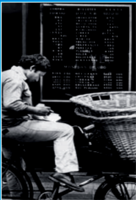
• Tabla de cotización de una casa de cambio en el microcentro porteño, la zona financiera de la ciudad de Buenos Aires (1980). "La tablita" de Martínez de Hoz establecía la devaluación mensual del peso

Al año siguiente profundizó esta política y tuvo lugar la implementación de un sistema de devaluación programada de la moneda, conocido como "la tablita", que incentivaría fuertemente la especulación financiera. Como consecuencia, numerosas entidades financieras cerraron, asumiendo el Estado sus deudas. Las tasas de interés crediticias también se liberalizaron, por lo cual muchos ciudadanos comprometidos con créditos hipotecarios perdieron sus viviendas.