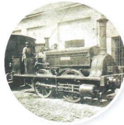
▲ Locomotora La Porteña. El 29 de agosto de 1857 realizó el primer viaje desde la Estación del Parque hasta La Floresta, en Buenos Aires.

También el nuevo Estado nacional necesitaba disponer de un ejército profesional para defender las fronteras del país, sobre todo en las zonas que todavía controlaban los pueblos originarios, y enfrentar los posibles problemas internos. Durante la presidencia de Mitre se creó el Ejército Nacional, y durante la presidencia de Sarmiento se fundó el Colegio Militar y la Escuela Naval.