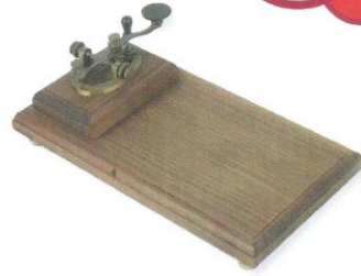
▲ Telégrafo que se utilizaba como medio de comunicación.

El telégrafo , por su parte, se implementó durante la presidencia de Sarmiento, y era un aparato que enviaba señales eléctricas que, mediante el código Morse, se traducían en palabras y letras.