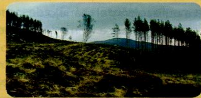
Muchas especies de árboles se encuentran en peligro de extinción como consecuencia de la tala indiscriminada.

Se renuevan constantemente, como las plantas y los animales. Existen muchas actividades económicas asociadas a la explotación de este tipo de recursos, como la agricultura, la ganadería, la pesca y la explotación forestal. Aunque se caracterizan por tener la posibilidad de regenerarse, los recursos renovables también pueden agotarse si no se utilizan con precaución. Por ejemplo, aunque los bosques son un recurso renovable, si no se otorga a los árboles el tiempo necesario para que crezcan y se los tala antes de tiempo, existe el peligro de que la especie desaparezca.