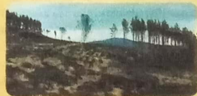
Muchas especies de árboles se encuentran en peligro de extinción como consecuencia de la tala indiscriminada.

Se renuevan constantemente, como las plantas y los animales. Existen muchas actividades económicas asociadas a la explotación de este tipo de recursos, como la agricultura, la ganadería, la pesca y la explotación forestal. Aunque se caracterizan por tener la posibilidad de regenerarse, los recursos renovables también pueden agotarse si no se utilizan con precaución. Por ejemplo, aunque los bosques son un recurso renovable, si no se otorga a los árboles el tiempo necesario para que crezcan y se los tala antes de tiempo, existe el peligro de que la especie desaparezca.