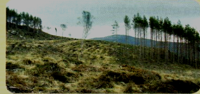
Muchas especies de árboles se encuentran en peligro de extinción como consecuencia de la tala indiscriminada.

Aunque se caracterizan por tener la posibilidad de regenerarse, los recursos renovables también pueden agotarse si no se utilizan con precaución. Por ejemplo, aunque los bosques son un recurso renovable, si no se otorga a los árboles el tiempo necesario para que crezcan y se los tala antes de tiempo, existe el peligro de que la especie desaparezca.