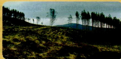
Muchas especies de árboles se encuentran en peligro de extinción como consecuencia de la tala indiscriminada.