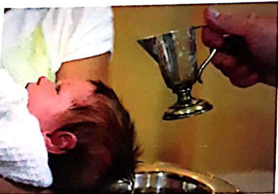
El sacramento del Bautismo.