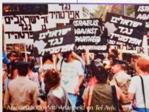
Manifestación Anti Apartheid en Tel Aviv.