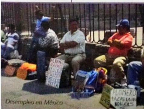
Desempleo en México