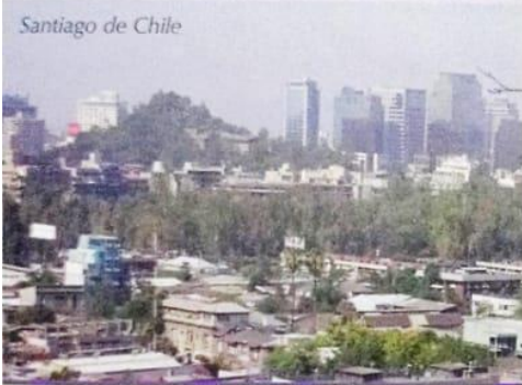
Santiago de Chile