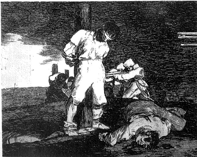
Doc. 2 Y no hay remedio . Grabado realizado por el pintor español Francisco de Goya, que da cuenta de las atrocidades llevadas a cabo por los franceses para reprimir los levantamientos populares en España.

Durante los meses posteriores la situación fue confusa porque cada junta comenzó a organizar sus propios ejércitos para enfrentar a los franceses. Con el objeto de unificar esos esfuerzos se formó la Junta Suprema