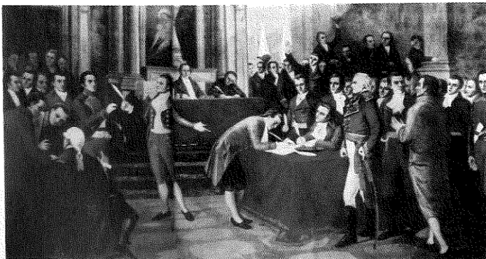
Doc. 7 Proclamación de la Independencia de Venezuela.

La reacción española fue inmediata, pues a los pocos días Domingo de Monteverde organizó fuerzas militares y comenzó su avance sobre la ciudad de Caracas. A ello se sumó una catástrofe natural: un terremoto destruyó gran parte de Caracas y otras poblaciones. La si-