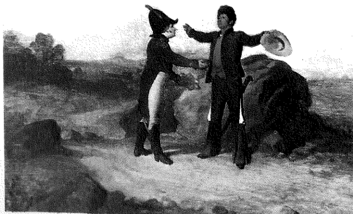
Doc. 11 Encuentro entre Agustín de Iturbide y Vicente Guerrero. Al unir sus tropas formaron el Ejército Trigarante.

Si bien en el Plan de Iguala se solicitaba a Fernando VII el envío de un miembro de la familia real para ser coronado como rey en México, este no aceptó hacerlo, pues eso significaría el reconocimiento de la independencia mexicana. Debido a ello Iturbide fue elegido por el congreso como emperador, adoptando el título de Agustín I .