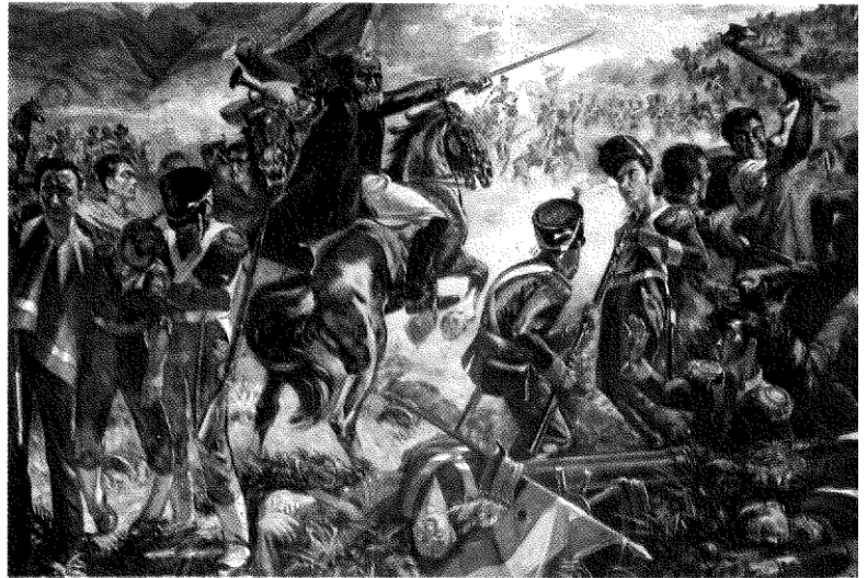
Doc. 8 Detalle de una batalla entre las fuerzas de Bolívar y los realistas.

Desde los llanos, Bolívar y Páez organizaron una expedición contra Nueva Granada. Esa expedición debió cruzar, con enormes dificultades, la Cordillera de los Andes, y en el camino fue recibiendo nuevos reclutas. Se conformó así un gran ejército libertador, con el cual los líderes revolucionarios vencieron a los realistas en Boyacá y en 1819 entraron en Bogotá. Poco después se convocó a elecciones de diputados para el congreso que se reunió en la ciudad de Angostura, durante el cual se planteó la necesidad de la unión militar y política entre Venezuela y Nueva Granada. Esa unión se concretó en 1822 y adoptó el nombre de Gran Colombia , a la que posteriormente se unieron las regiones de Panamá y Quito.