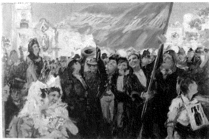
Doc. 5 Festejos populares el día de la proclamación de la Constitución de Cádiz, el 19 de marzo de 1812.

El Semanario Patriótico fue fundado en Madrid por el poeta Manuel José Quintana, en septiembre de 1808. Su presentación se inicia con una apelación a la opinión pública, “mucho más fuerte que los ejércitos armados”, nacida de las circunstancias extraordinarias que la invasión napoleónica produjo en España. Según Quintana, la opinión pública debía coronar los esfuerzos de la lucha por la conservación de la independencia y la soberanía, mediante reformas políticas que evitaran caer a España nuevamente en la tiranía. El Semanario Patriótico fue el portavoz del sector liberal que integraba la Junta Central. Se publicó hasta 1812.